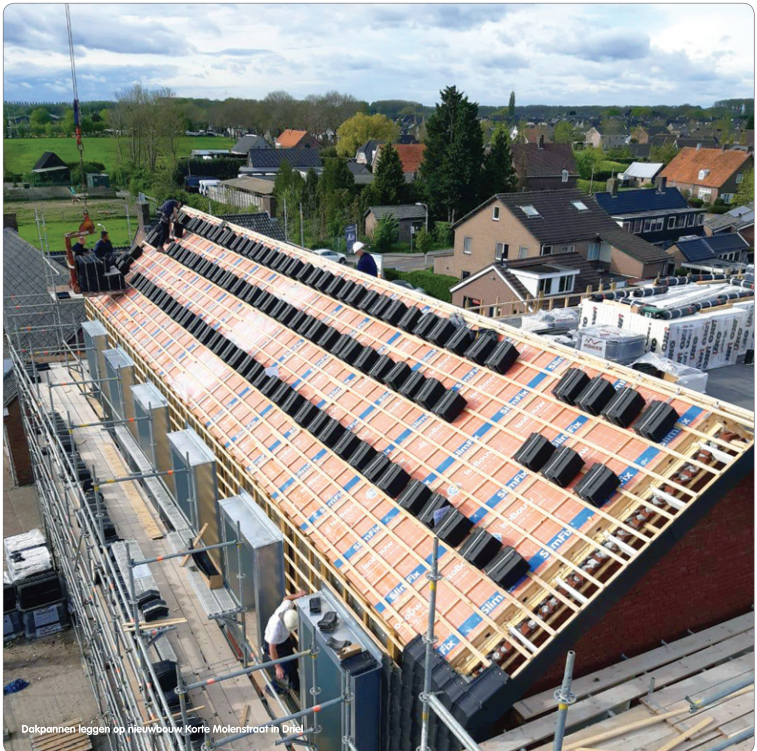
Dakpannen leggen op nieuwbouw Korte Molenstraat in Driel